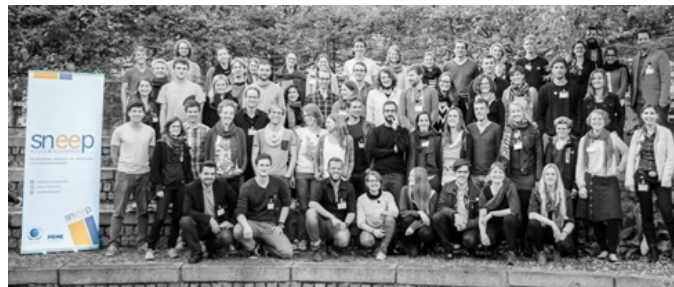
sneep - Frühjahrstagung

Ressourcenschonendes Produkt: Klimaneutral produziert mit Biodruckfarben und Recyclingpapier.